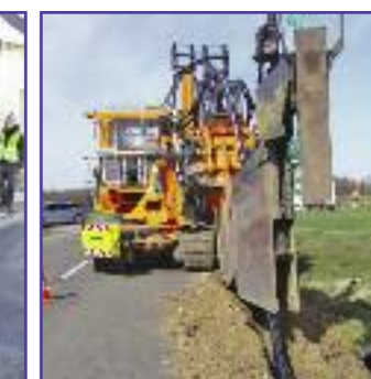
Travaux d'enfouissement de la fibre optique