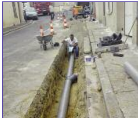
Réfection du réseau d'eau pluviale rue de Cléry