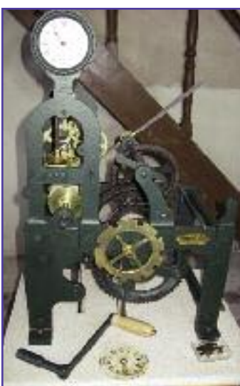
Le mécanisme de l'horloge de l'église restauré par M. Marteau