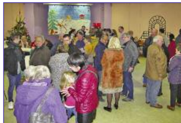
Les vœux du Maire 2019 et le partage de la galette