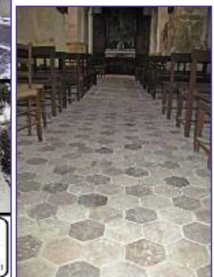
Rénovation du sol de l'église avec des tomettes