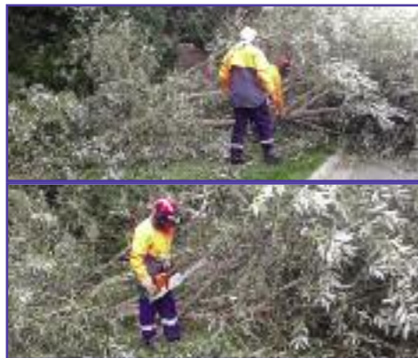
Abattage d'un arbre par les pompiers au Chemin de la Marettte