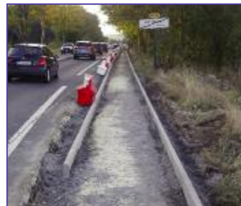
Création du chemin piétonnier le long du CD915, reliant Artimont à Marines