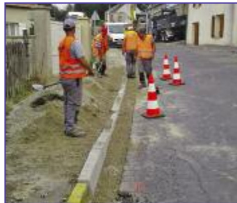
Réfection des trottoirs de la rue des Petites Fontaines