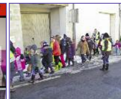
Les enfants "en cordée" au retour de la cantine en février