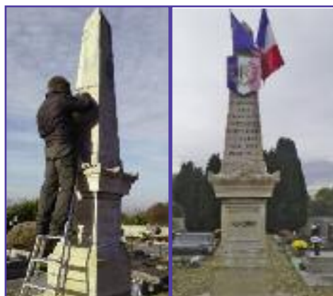
Regravage et rechapissage du Monument aux Morts