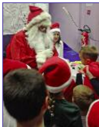
Noël des enfants organisé par l'école et les parents d'élèves