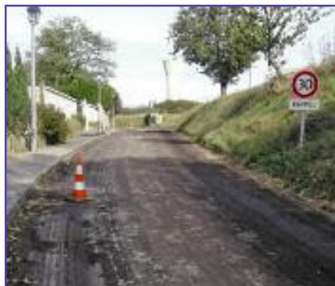
Réfection de la rue des Petites Fontaines