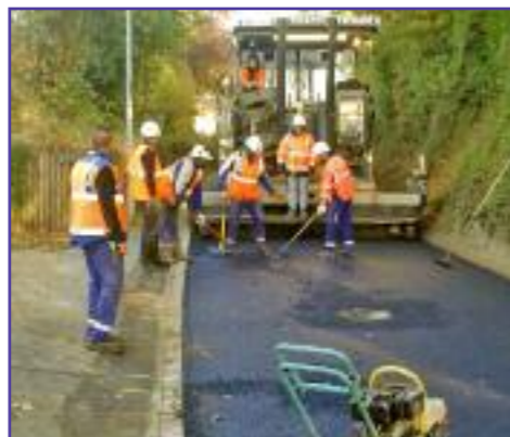
Réfection de la rue des Petites Fontaines