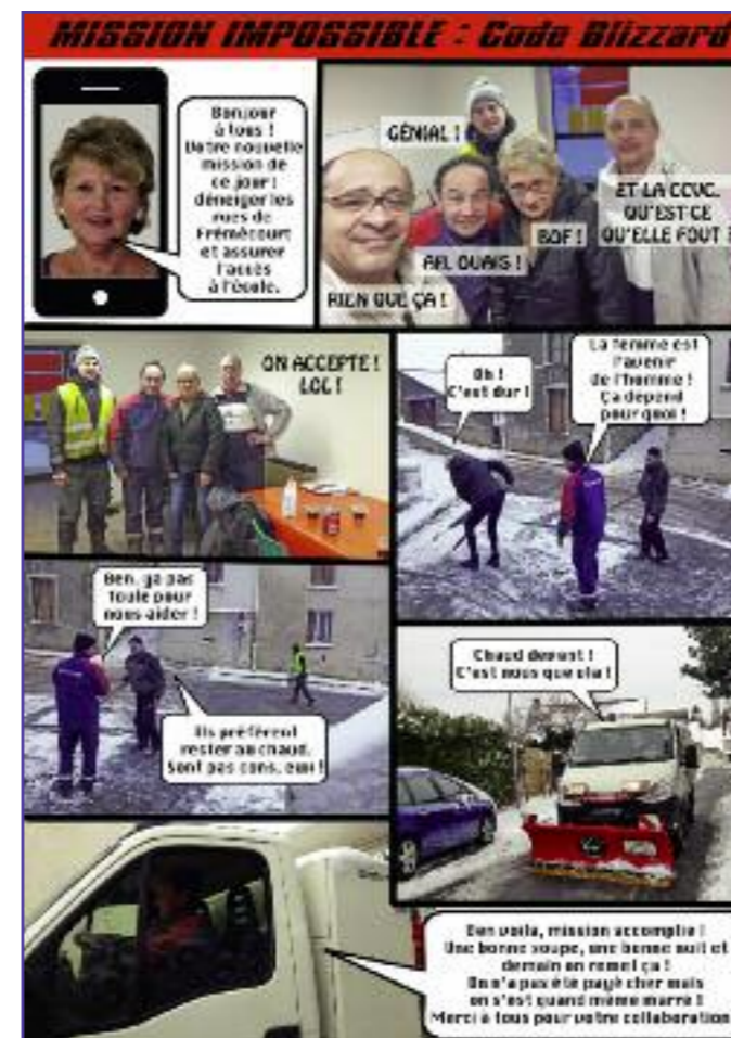
Déneigement du parvis de l'école et de l'église en février "vu sous le trait de l'humour"