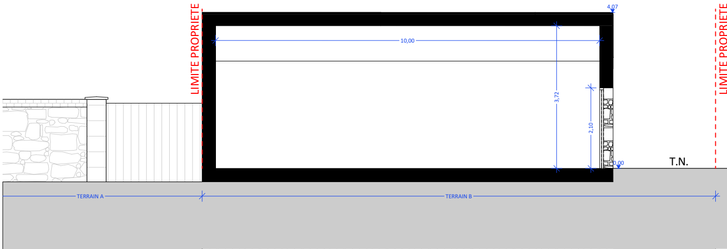
COUPE AA' EXISTANT